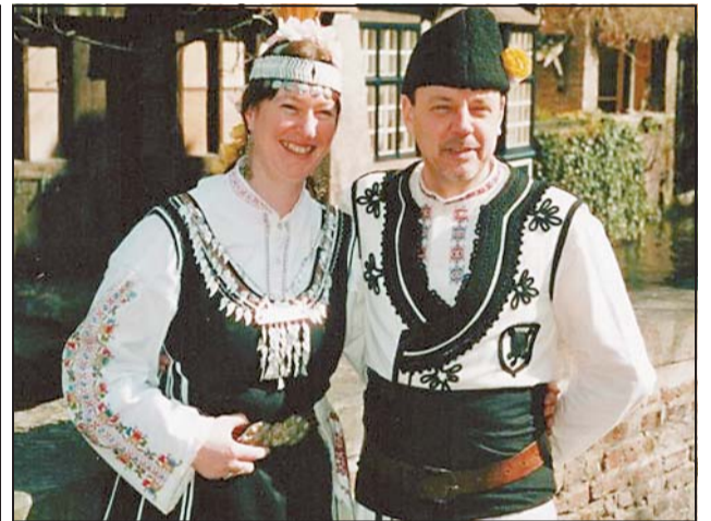
Последните творби на сърцатите белгийци са тези ръчно изработени шопски носии, допълнени с прочелник, калпак и ефектен накит

началото трудно набират танцьори - допреди приемането ни в Европейския съюз белгийците почти не се интересуват от българската култура. През октомври 1999 г. за първи път ги канят да веселят гостите на частно парти. "Тогава бяхме... само трима - пише Ан. - Ние играхме със сватбените си костюми. Другият танцьор си носеше собствена носия." В момента съставът наброява двайсетина души, сред които има и белгийци, и българи. "Националността няма значение - твърди събеседничката ми. - Танцът и музиката са своеобразни международни езици, те размиват границите между хората." За да усъвършенства хореографията си, семейство Сансен редовно се обръща за помощ към изтъкнати български специалисти като Костадин Руйчев, Гергана Панова от ансамбъл "Филип Кутев", Белчо Станев от "Варна", Тончо и Магдаленка Кисьо-