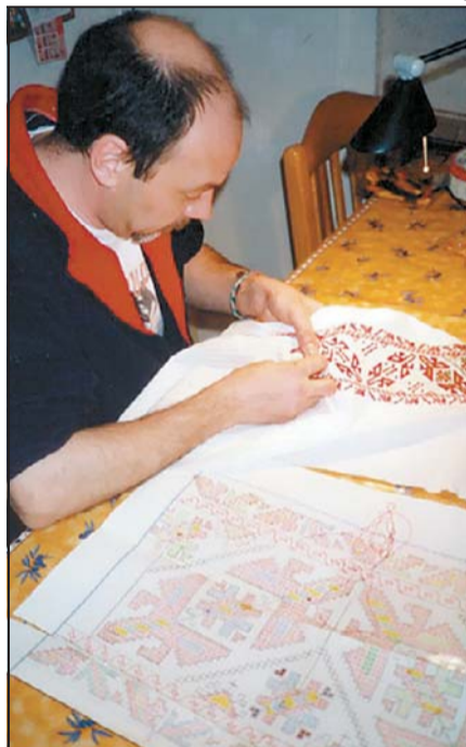
Ален бродира белоснежните кошули на ансамбъла

"Всичките ни познати ни смятат за чудаци - продължава белгийката. - Дори приятелите ни хореографи не разбират лудешкото ни увлечение по вашата страна. Ние обаче не можем да