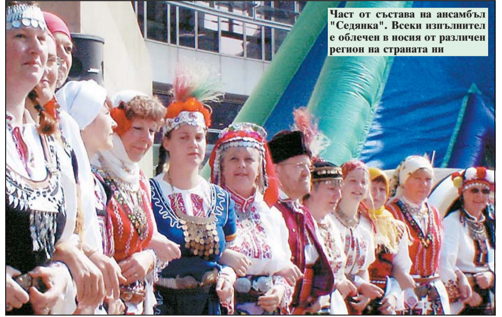
Част от състава на ансамбъл "Седянка". Всеки изпълнител е облечен в носия от различен регион на страната ни