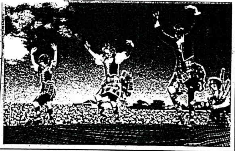
SCOTTISH HIGHLAND DANCERS

Un bonjour d'Écosse où le hilt est une attraction. Yvette