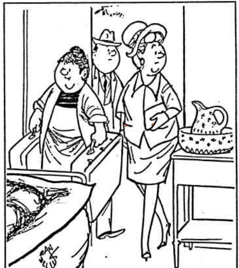
- L'hôtel s'est bien modernisé... on a profité de la morte-saison pour changer les cuvettes. (I.F.S.)

CI-DESSUS UN BREF "FLASH" DE LA VISITE DE PIERRE ET LUCIENNE DANS LES HÔTELS DE PARIS.